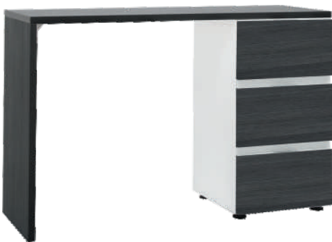
NRO 36 osat 33 + 10 tassuilla L 115 K 75 S 39