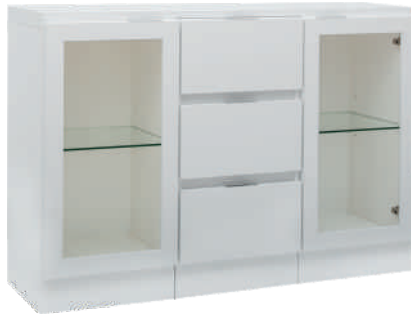
NRO 2 osat 12/V + 10 + 12/O + kansi 120 cm L 120 K 82 S 39