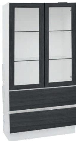
OSA 29 Vitriini L 80 K 152 S 39 2 laatikkoa, 2 lasihyllyä