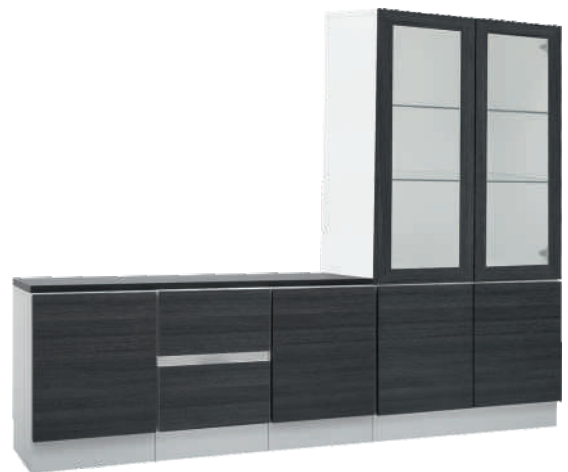
NRO 37 osat 2/V + 1 + 2/0 + 28 + kansi 120 cm L 160 K 152 S 39