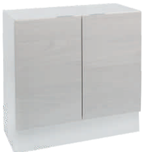
OSA 17 Kaappi L 80 K 80 S 39 1 hylly