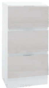
OSA 10 Lipasto L 40 K 80 S 39 3 laatikkoa