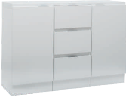
NRO 1 osat 11/V + 10 + 11/O + kansi 120 cm L 120 K 82 S 39