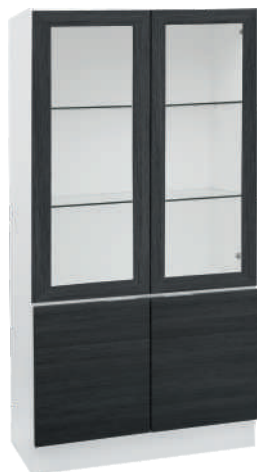
OSA 28 Vitriini L 80 K 152 S 39 1 puuhylly, 2 lasihyllyä