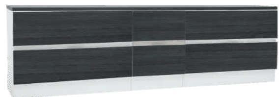
NRO 41 4 + 1 + 4 + kansi 200 cm L 200 K 58 S 39