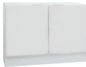
OSA 8 Kaappi L 80 K 56 S 39 1 hylly