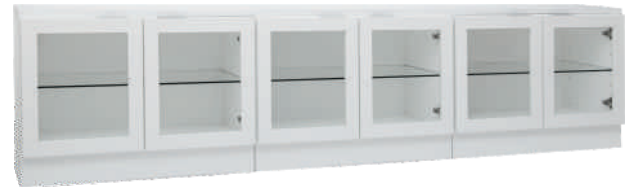
NRO 31 osat 9 + 9 + 9 + kansi 240 cm L 240 K 58 S 39