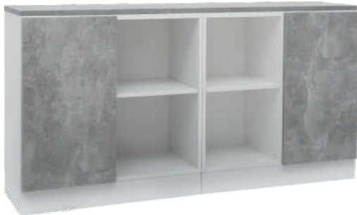
NRO 10 osat 16 + 15 + kansi 160 cm L 160 K 82 S 39