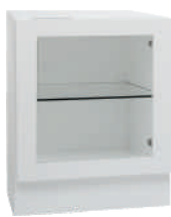
OSA 3 Lasikaappi L 40 K 56 S 39 1 lasihylly