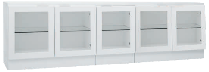
NRO 21 osat 9 + 3/0 + 9 + kansi 200 cm L 200 K 58 S 39