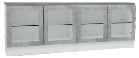
NRO 24 osat 9 + 9 + kansi 160 cm L 160 K 58 S 39