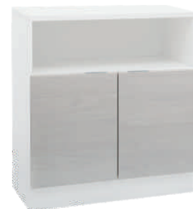
OSA 14 Kaappi L 80 K 80 S 39 1 hylly