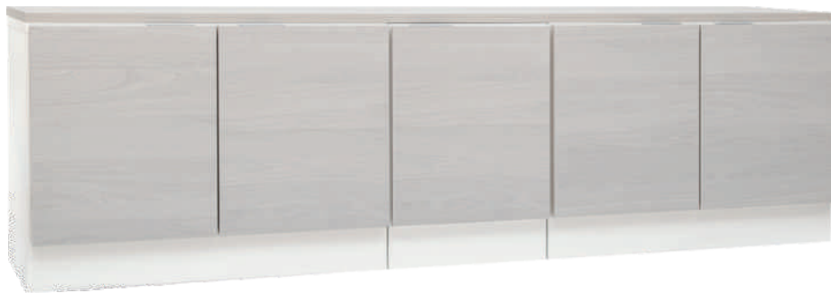
NRO 32 8 + 2/0 + 8 + kansi 200 cm L 200 K 58 S 39