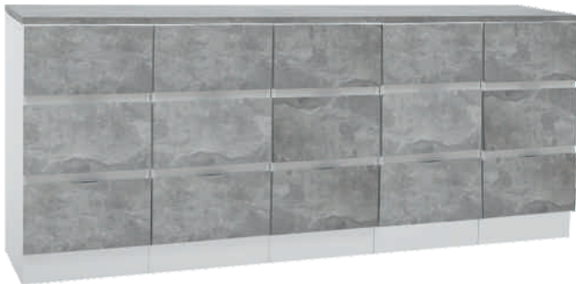
NRO 12 osat 10 + 10 + 10 + 10+ 10 + kansi 200 cm L 200 K 82 S 39