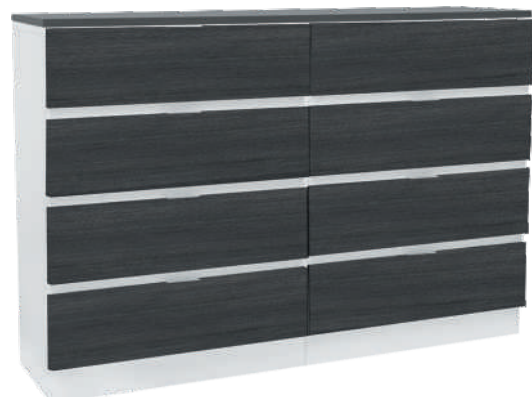
NRO 15 osat 22 + 22 + kansi 160 cm L 160 K 107 S 39