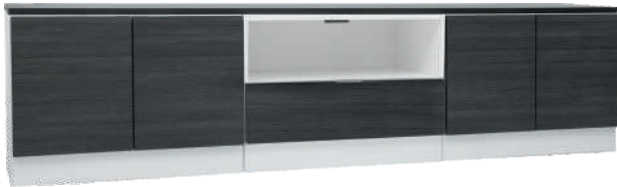
NRO 28 osat 8 + 5 + 8 + kansi 240 cm L 240 K 58 S 39