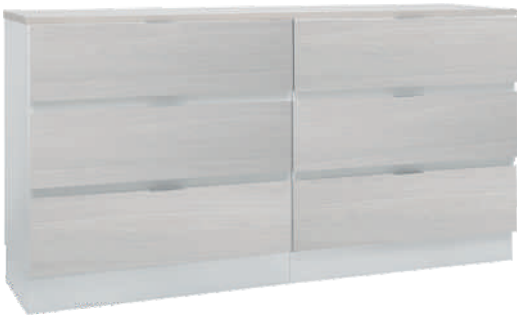
NRO 8 osat 13 +13 + kansi 160 cm L 160 K 82 S 39