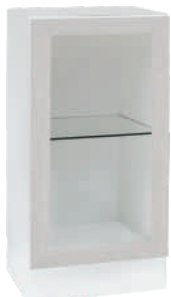
OSA 12 Lasikaappi L 40 K 80 S 39 1 lasihylly