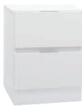
OSA 1 Lipasto L 40 K 56 S 39 2 laatikkoa

Ovien käteisyys on valittavissa tilauksen yhteydessä.