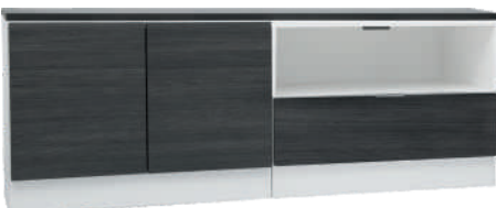
NRO 38 osat 8 + 5 + kansi 160 cm L 160 K 58 S 39