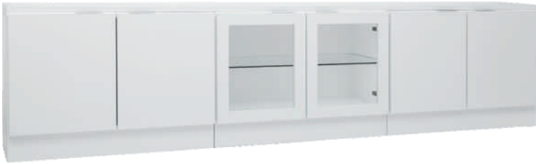
NRO 18 osat 8 + 9 + 8 + kansi 240 cm L 240 K 58 S 39