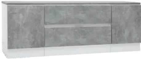
NRO 25 osat 2/V + 4 + 2/0 + kansi 160 cm L 160 K 58 S 39