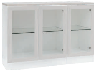
NRO 34 osat 18 + 12/0 + kansi 120 cm L 120 K 82 S 39