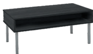
OSA 32 Sohvapöytä L 90 K 40 S 60