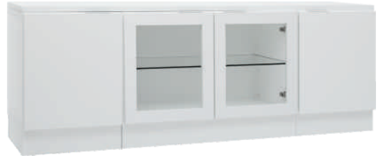
NRO 19 osat 2/V + 9 + 2/0 + kansi 160 cm L 160 K 58 S 39