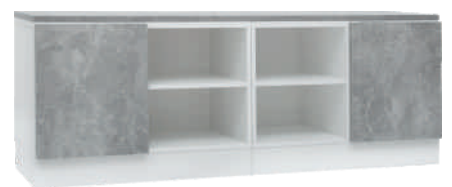
NRO 27 osat 7 + 6 + kansi 160 cm L 160 K 58 S 39