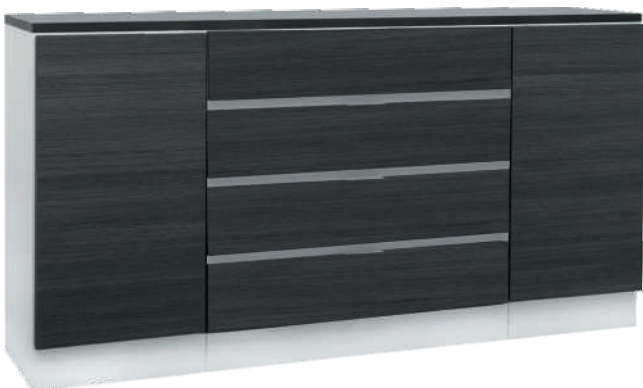
NRO 14 osat 20/V + 22 + 20/O + kansi 160 cm L 160 K 107 S 39