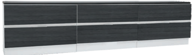
NRO 39 osat 4 + 4 + 4 + kansi 240 cm L 240 K 58 S 39