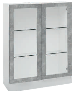
OSA 27 Lasikaappi L 80 K 105 S 39 2 lasihyllyä