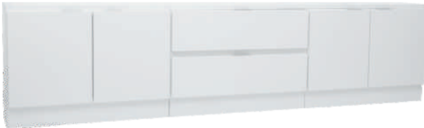
NRO 30 osat 8 + 4 + 8 + kansi 240 cm L 240 K 58 S 39