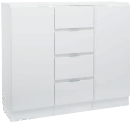
NRO 4 osat 20/V + 19 + 20/O + kansi 120 cm L 120 K 107 S 39