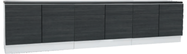
NRO 29 osat 8 + 8 + 8 + kansi 240 cm L 240 K 58 S 39