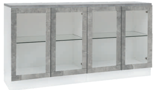
NRO 13 osat 18 + 18 + kansi 160 cm L 160 K 82 S 39