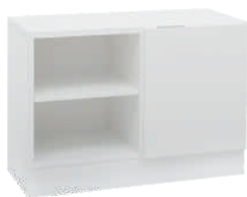
OSA 6 Kaappi L 80 K 56 S 39 2 hyllyä

Kaapistojen välilylyt ovat siirrettäviä.