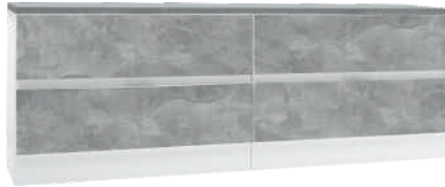
NRO 26 osat 4 + 4 + kansi 160 cm L 160 K 58 S 39