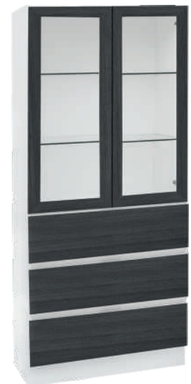
OSA 31 Vitriini L 80 K 176 S 39 3 laatikkoa, 2 lasihyllyä