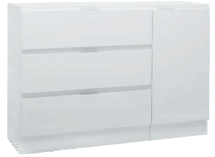
NRO 3 osat 13 + 11/O + kansi 120 cm L 120 K 82 S 39