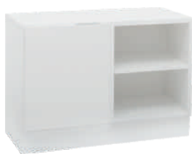
OSA 7 Kaappi L 80 K 56 S 39 2 hyllyä