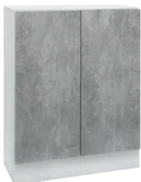
OSA 26 Kaappi L 80 K 105 S 39 2 hyllyä