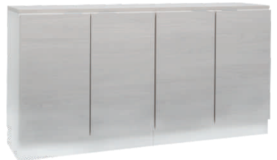
NRO 35 osat 26 + 26 + kansi 160 cm L 160 K 107 S 39