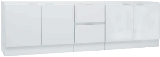
NRO 20 8 + 1 + 8 + kansi 200 cm L 200 K 58 S 39