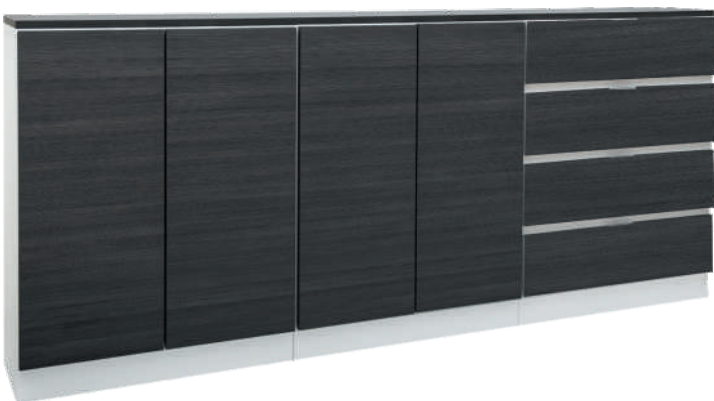
NRO 16 osat 26 + 26 + 22 + kansi 240 cm L 240 K 107 S 39