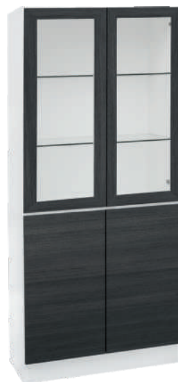
OSA 30 Vitriini L 80 K 176 S 39 1 puuhylly, 2 lasihyllyä