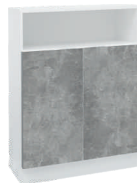
OSA 23 Kaappi L 80 K 105 S 39 1 hylly