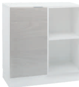
OSA 16 Kaappi L 80 K 80 S 39 2 hyllyä