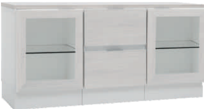
NRO 33 osat 3/V + 1 + 3/0 + kansi 120 cm L 120 K 58 S 39