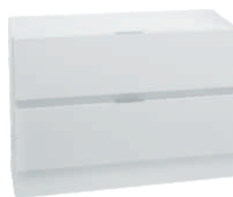
OSA 4 Lipasto L 80 K 56 S 39 2 laatikkoa