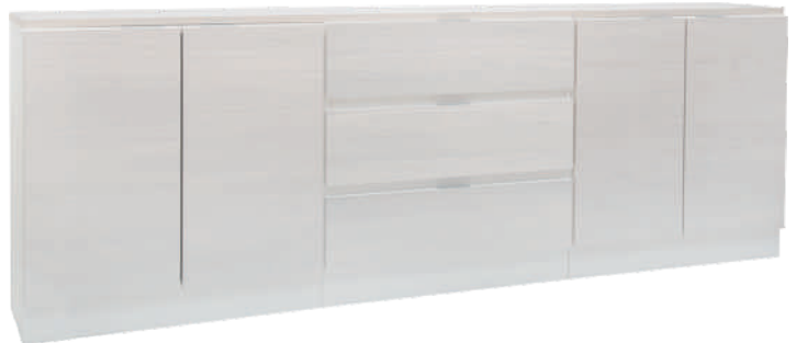
NRO 7 osat 17 + 13 + 17 + kansi 240 cm L 240 K 82 S 39