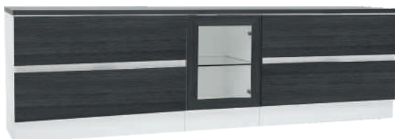
NRO 40 4 + 3/0 + 4 + kansi 200 cm L 200 K 58 S 39