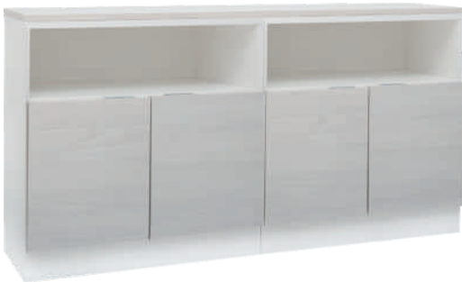
NRO 6 osat 14 + 14 + kansi 160 cm L 160 K 82 S 39