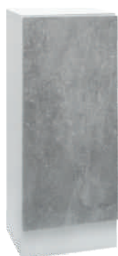
OSA 20 Kaappi L 40 K 105 S 39 2 hyllyä