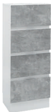
OSA 19 Lipasto L 40 K 105 S 39 4 laatikkoa