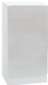
OSA 11 Kaappi L 40 K 80 S 39 1 hylly