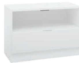
OSA 5 Lipasto L 80 K 56 S 39 1 laatikko