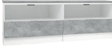
NRO 23 osat 5 + 5 + kansi 160 cm L 160 K 58 S 39