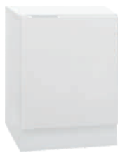
OSA 2 Kaappi L 40 K 56 S 39 1 hylly