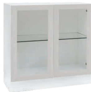
OSA 18 Lasikaappi L 80 K 80 S 39 1 lasihylly