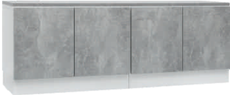
NRO 22 osat 8 + 8 + kansi 160 cm L 160 K 58 S 39