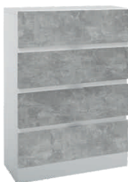
OSA 22 Lipasto L 80 K 105 S 39 4 laatikkoa