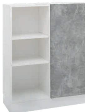
OSA 24 Kaappi L 80 K 105 S 39 4 hyllyä