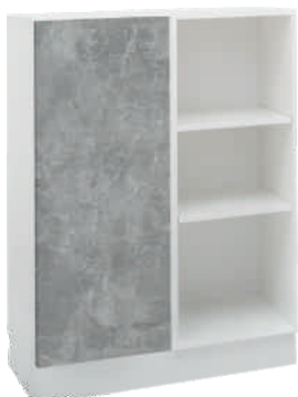
OSA 25 Kaappi L 80 K 105 S 39 4 hyllyä