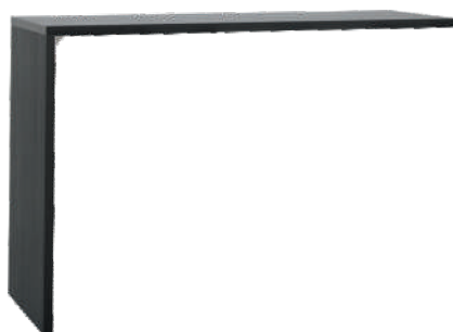
OSA 33 Kirjoituspöydän L-taso L 115 K 75 S 40

Kirjoituspöydän L-tasoa voidaan käyttää seuraavien tassuilla olevien tuotteiden kanssa: Nro 10, 11, 12, 13, 14, 15, 16, 17, 18