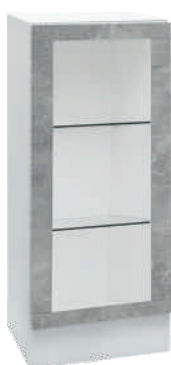
OSA 21 Lasikaappi L 40 K 105 S 39 2 lasihyllyä