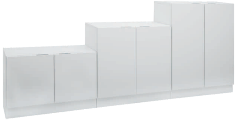
NRO 5 osat 8 + 17 + 26 L 240 K 105 S 39