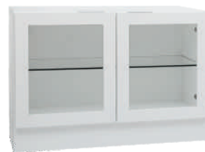
OSA 9 Lasikaappi L 80 K 56 S 39 1 lasihylly