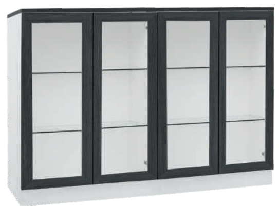
NRO 17 osat 27 + 27 + kansi 160 cm L 160 K 107 S 39